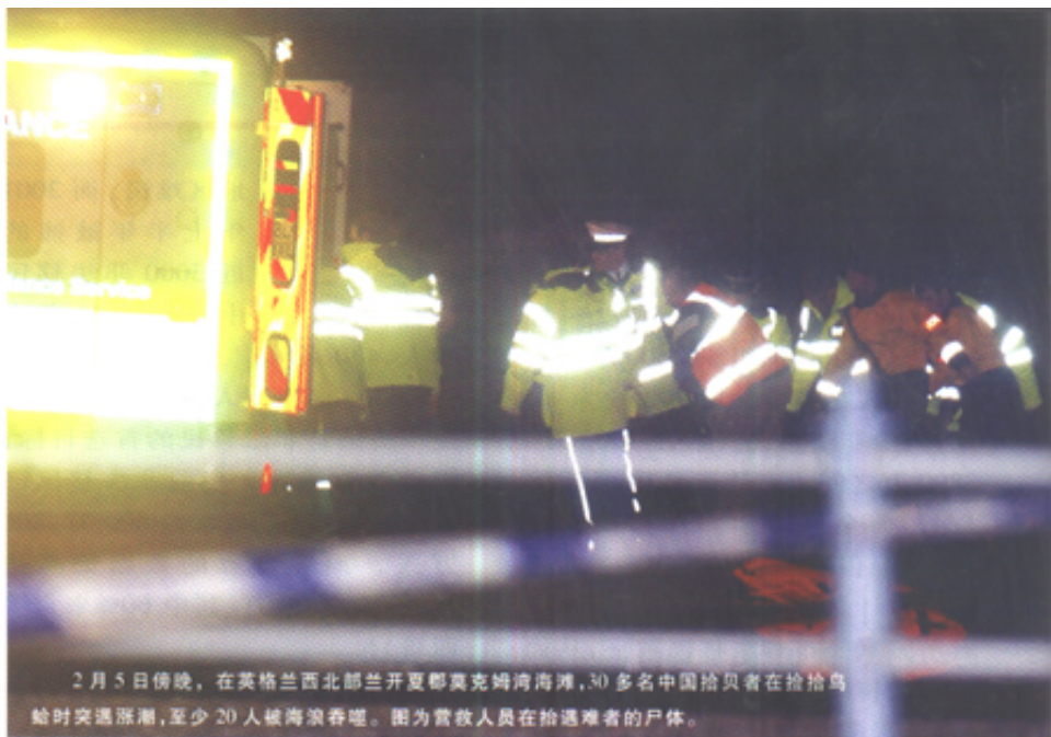
2月5日傍晚,在英格兰西北部兰开夏郡莫克姆湾海滩,30多名中国拾贝者在捡拾鸟蛤时突遇涨潮,至少20人被海浪吞噬。图为营救人员在抬遇难者的尸体。

非法移民的大量涌入在导致一些国家犯罪率急速上升、就业问题严重的同时,也严重影响到经济安全和社会稳定。非法移民也对输出国造成了危害,使经济发展因劳动力缺乏而受到影响、社会资金不足。另外,由此导致的社会秩序失衡、犯罪和恐怖主义滋生等状况也是各国政府的头痛事。