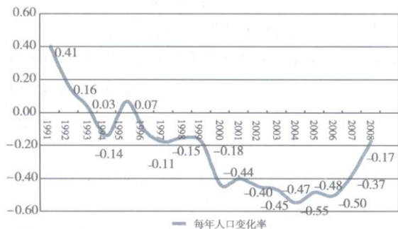
图 1 1991~2008年俄罗斯人口增长率(%)