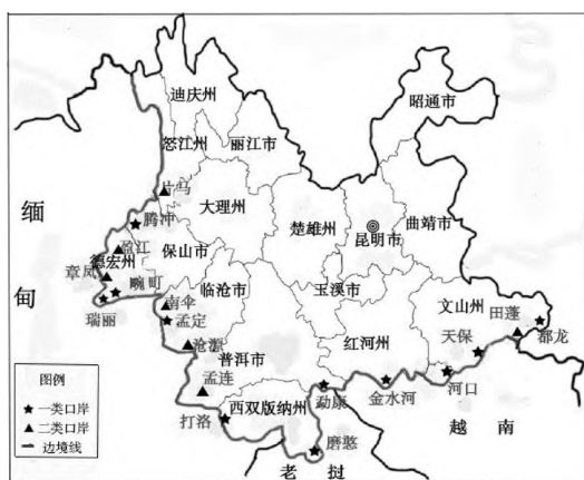
图1 云南主要口岸分布

中国与缅甸、老挝、越南三国接壤,与泰国、柬埔寨、孟加拉、印度等国相距不远。云南省与邻国的边界线总长为4060公里,其中中缅段1997公里,中老段710公里,中越段1353公里。有出境公路20多条,15个民族与境外相同民族在国境线两侧居住。如图1所示,云南有8个边境州市,25个边境县,12个国家级口岸,8个省级口岸和无数条边民通道、小道、便道,出入境流量大 [3] 。在云南西侧,与缅甸北部的木姐等城市依山相连,在瑞丽段长达503km的边境线上,建立了“一寨两国”“一井两国”等世界闻名的友谊边境的典范。也正是由于国境线长,难以计数的小道,每天通过小道非法出入境的外籍人员和本国人员近千人,高峰时能到达万人。非法出入境人员有的是进行走私、贩毒等违法犯罪活动 [4] 。