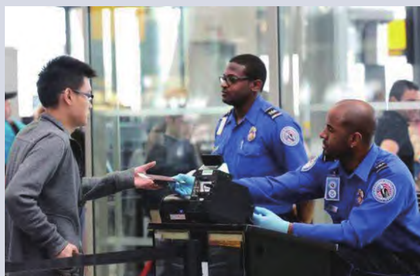
海关查验旅客通关手续

管理和行政局指导和维护总局的预算、支出、会计和财务、采购、设施、财产、政策和保密计划完全符合联邦法律和条例；提供坚实的集成信息技术基础设施；建立收购策略，监督采购活动和合同，执行健全和具有成本效益的财务管理政策、标准和制度。此外，积极加强内部合作，确保及时响应《信息自由法》的要求，并支持整个执法局