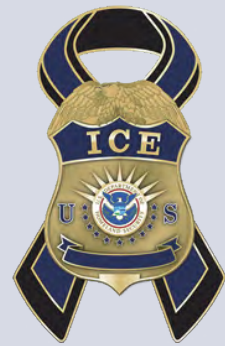
美国移民和海关执法局徽章

作为对“9·11”事件的回应，国会授权美国移民和海关执法局为同时享有民事和刑事执法权的独特组合体，开展边境管制、海关、贸易和移民等管理工作，主要任务是通过刑事调查和执行移民法减轻跨国威胁，保护国家、社会、合法移民、贸易、旅行和金融系统安全，总局位于华盛顿特区第 12 西南大街 500 号，并在国内外开设 400 多个办事处，拥有 2 万多名执法人员和保障队伍，运作的年度预算约为 80 亿美元。