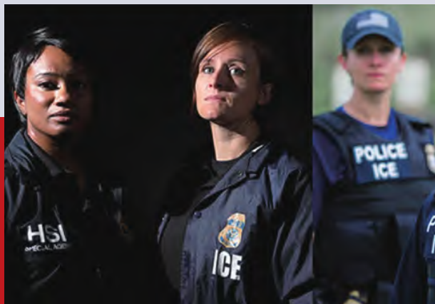
美国移民和海关执法局女警