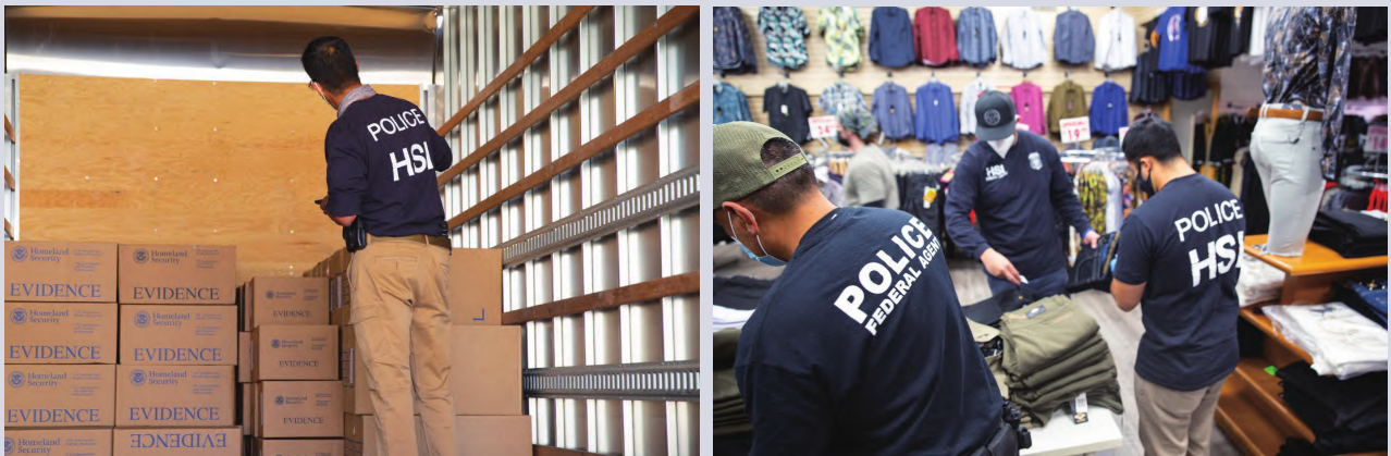
国土安全调查局警员在查证货品

疗用品), 为虚假慈善机构进行欺诈筹款, 以及其他金融救济骗局。其中许多诈骗计划以老年人为目标。通过监测, 国土安全调查局识别出诈骗案例, 警示消费者提高认识、防止上当受骗; 联邦贸易委员会也发出提醒, 让消费者和企业警惕最新的骗局; 金融犯罪执法网络向金融机构发布应对新冠病毒大流行的指导意见和相关信息。通过全面的反洗钱计划, 保持强大的“了解你的客户”实践, 遵守银行保密法和其他行业报告要求。官方号召相关机构加强沟通, 促进公私伙伴关系, 积极与当地国土安全调查局办事处合作, 保持开放的沟通渠道, 报告可疑活动。警方也提示公众, 如果怀疑自己被骗了, 立即向当地执法部门报案, 并通过 Covid19Fraud@dhs.gov 联系国土安全调查局。