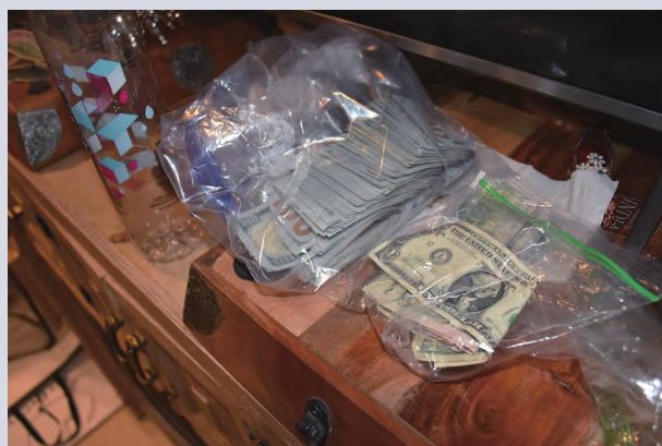
执法人员缴获的涉嫌海关欺诈美元

举报内容包括：恐怖主义和大规模杀伤性武器、贩卖人口（强迫劳动/奴役）、儿童剥削/色情和性旅游、跨国