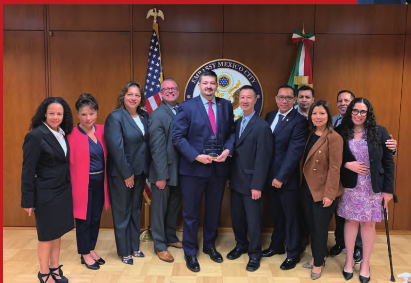
国际刑警组织墨西哥总干事多明格斯·马丁内斯获颁 2021 年模范执法伙伴关系奖