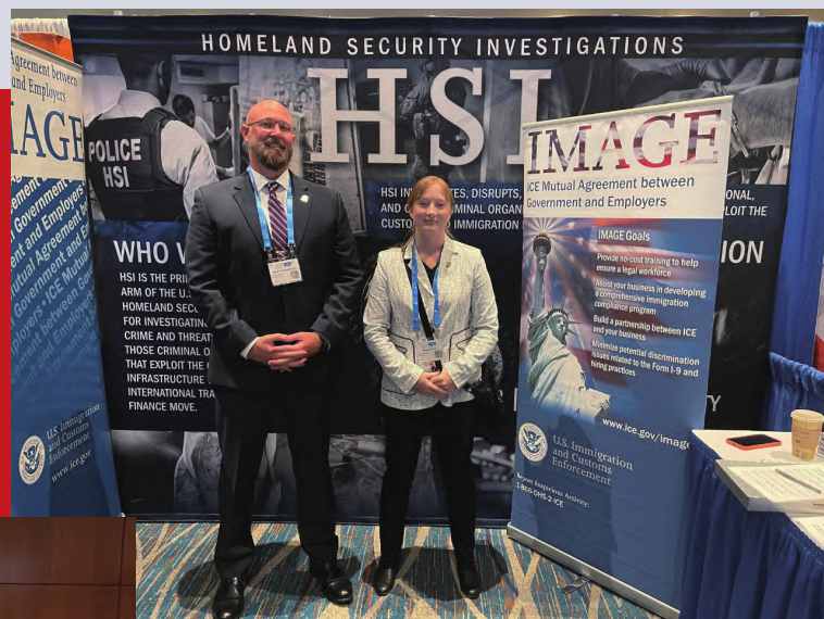
美国国土安全调查局在 2022 年人力资源佛罗里达会议与博览会上，展示与美国商界的自愿合作项目