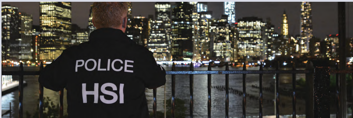
国土安全调查局警员

虽然执法和驱逐行动局在边境附近投入大量人力和物力，但其大多数移民执法行动都发生在内地。为实现移民执法目标，它不断加强与国内外执法伙伴合作，其中最显著的执法协调和伙伴关系工作之一是对被关押在联邦、州和地方监狱及拘留所中的重点非法个体进行生物识别和身份确认，包括利用生物识别技术鉴定因刑事犯罪而被捕的