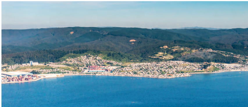
智利康塞普西翁湾