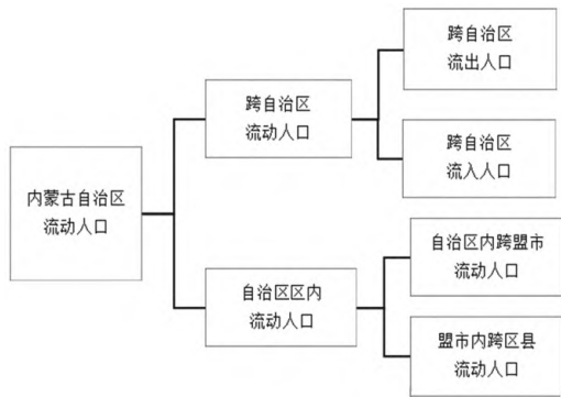
图1 内蒙古自治区流动人口分析框架

我们可以把自治区流动人口划分为跨自治区流动人口和自治区区内流动人口。其中,跨自治区流动人口可以分为跨自治区流出人口和跨自治区流入人口。跨自治区流出人口是指,流动人口把自治区以外的地区作为流动目标地,跨自治区流入人口是自治区外的流动人口把自治区作为流动目标地。自治区区内流动人口是指,流动人口以自治区内的地区作为流动目标地,流动过程仅在自治区内部。自治区区内流动人口又可以分为自治区内跨盟市流动人口和盟市内跨区县流动人口(见图1)。